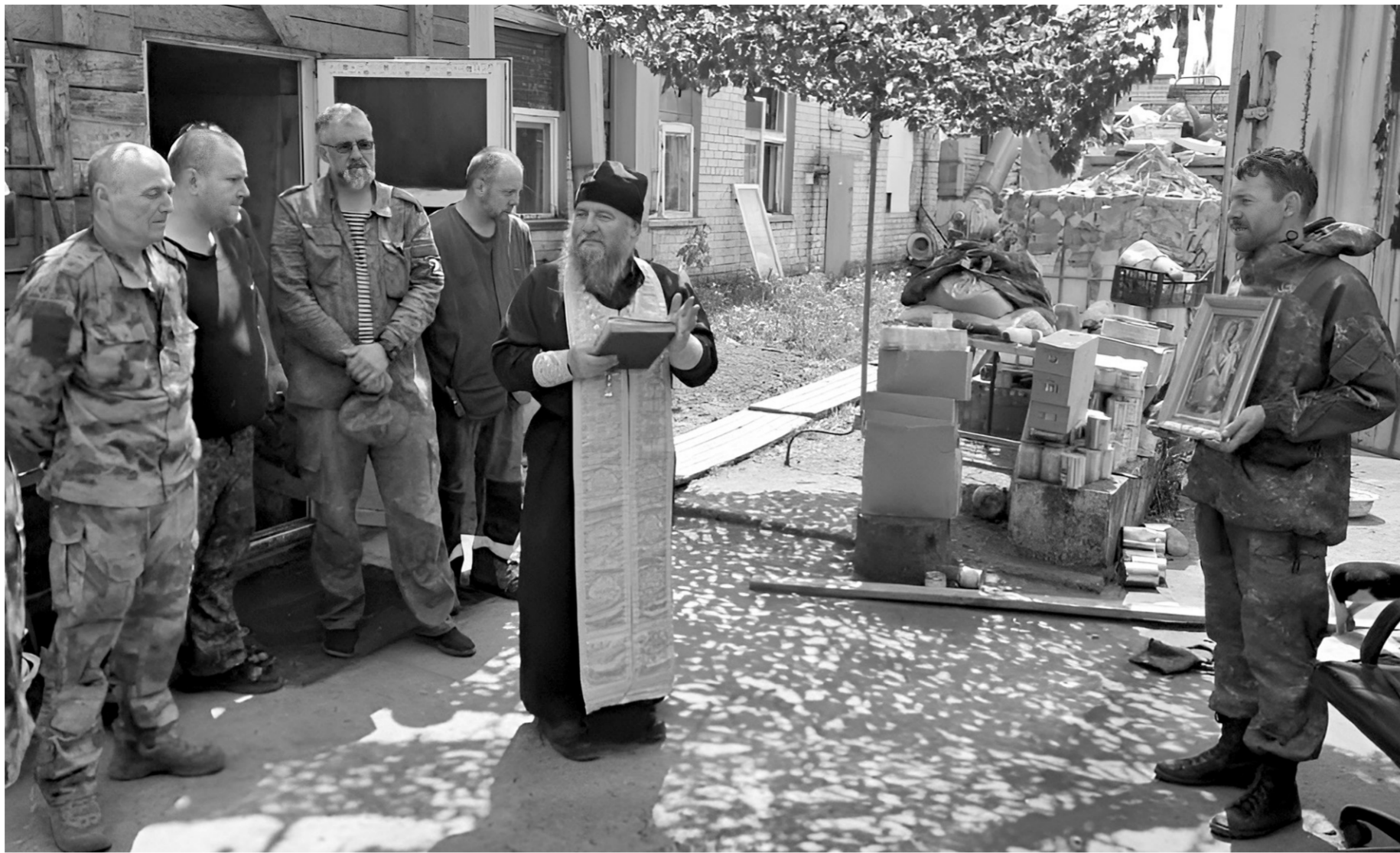
Молитва вместе с бойцами 310-го стрелкового батальона 2-го корпуса Народной милиции ЛНР

— Когда начинаешь говорить им о вере, они настораживаются, боятся даже шевельнуться. Их вера жива, трепетна, их отношение к Богу искренне. Они приходили на исповедь, падали на колени и начинали каяться за свои грехи. Каялись искренне, безавно. Им было все равно, как они выглядят со стороны, что могут подумать другие. Они не стеснялись своих слез. Мы вместе проводили крещение, беседовали, а затем они отправи-