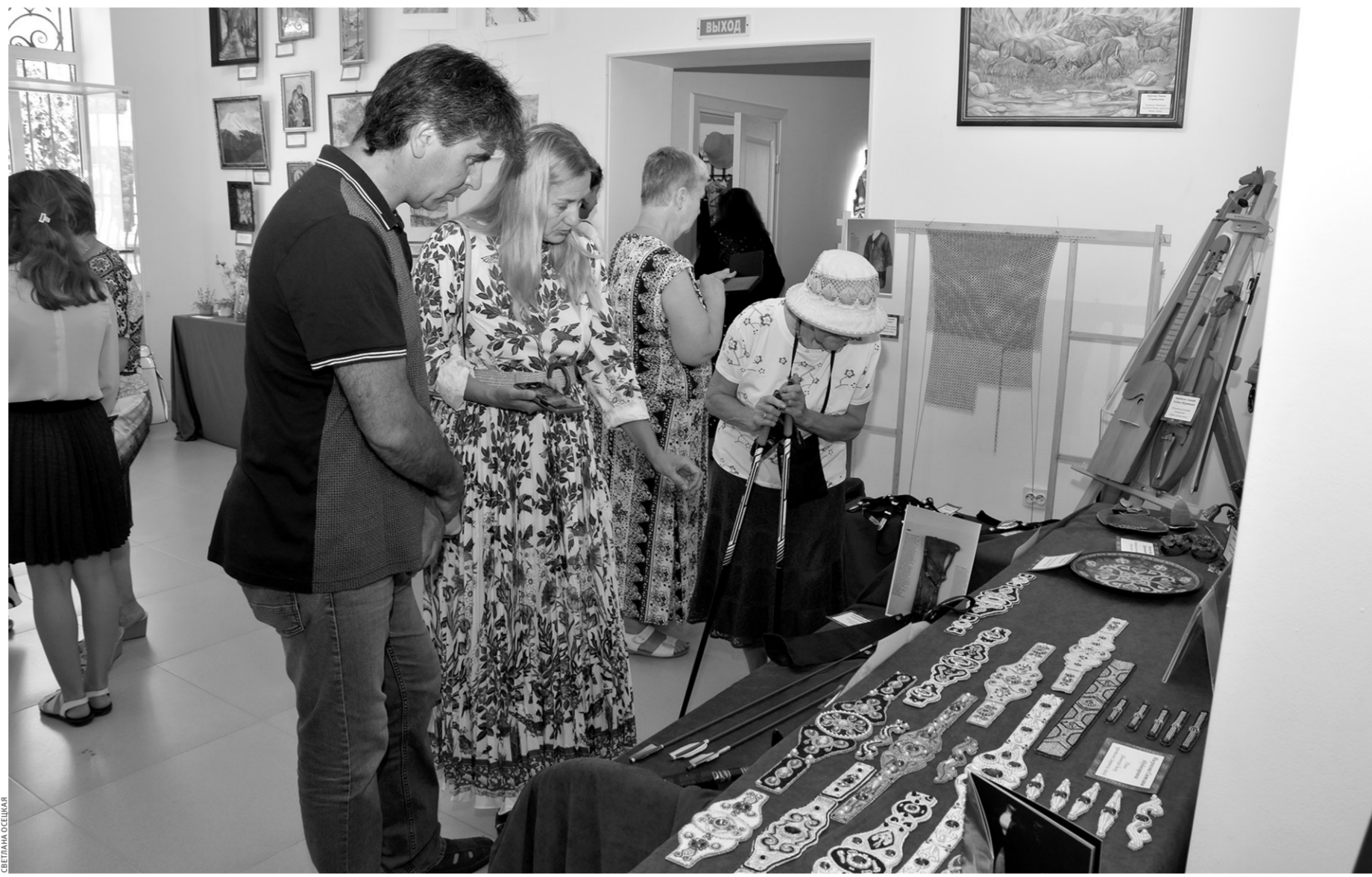
На выставке представлено огромное количество работ наших самодеятельных мастеров

Профессионализм ещё одного мастера лично отмечает пред-