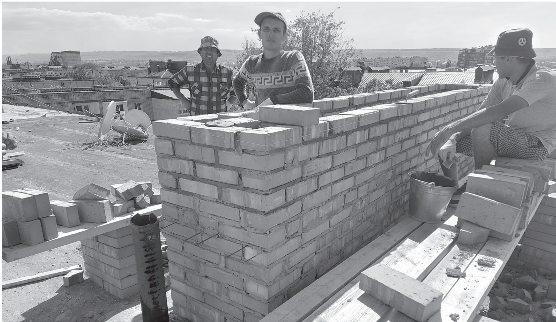
Идут ремонтные работы на крыше многоквартирного жилого дома

— В ходе строительного контроля уделялось особое внимание качеству и объему выполняемых работ, и в случае выявления каких-либо недостатков подрядную организацию обязывали устранить нарушения в кратчайшие сроки. Так что ни